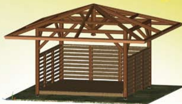
STRUCTURE AVEC OPTIONS (PLANCHER, VENTELLES) à partir de 5210,79 €