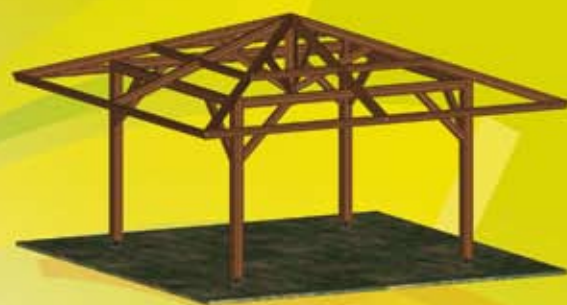
STRUCTURE SEULE à partir de 2905,51 €